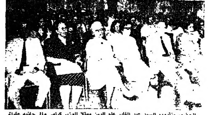
الخبير بتعليم السيد عبد القادر علم الدين معالي الوزير كرامي والى جانبه عقيلة محافظ الشمال اسكندر غبريل